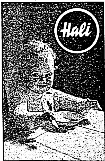
Werkphoto einer HALI-Puppe